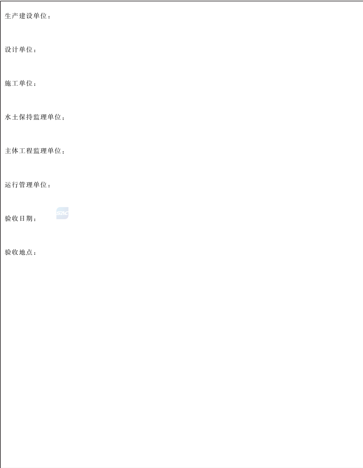
表 E.2 单位工程验收鉴定书扉页格式