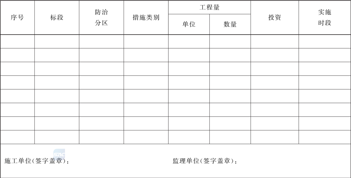
表 H.3 水土保持临时措施统计表