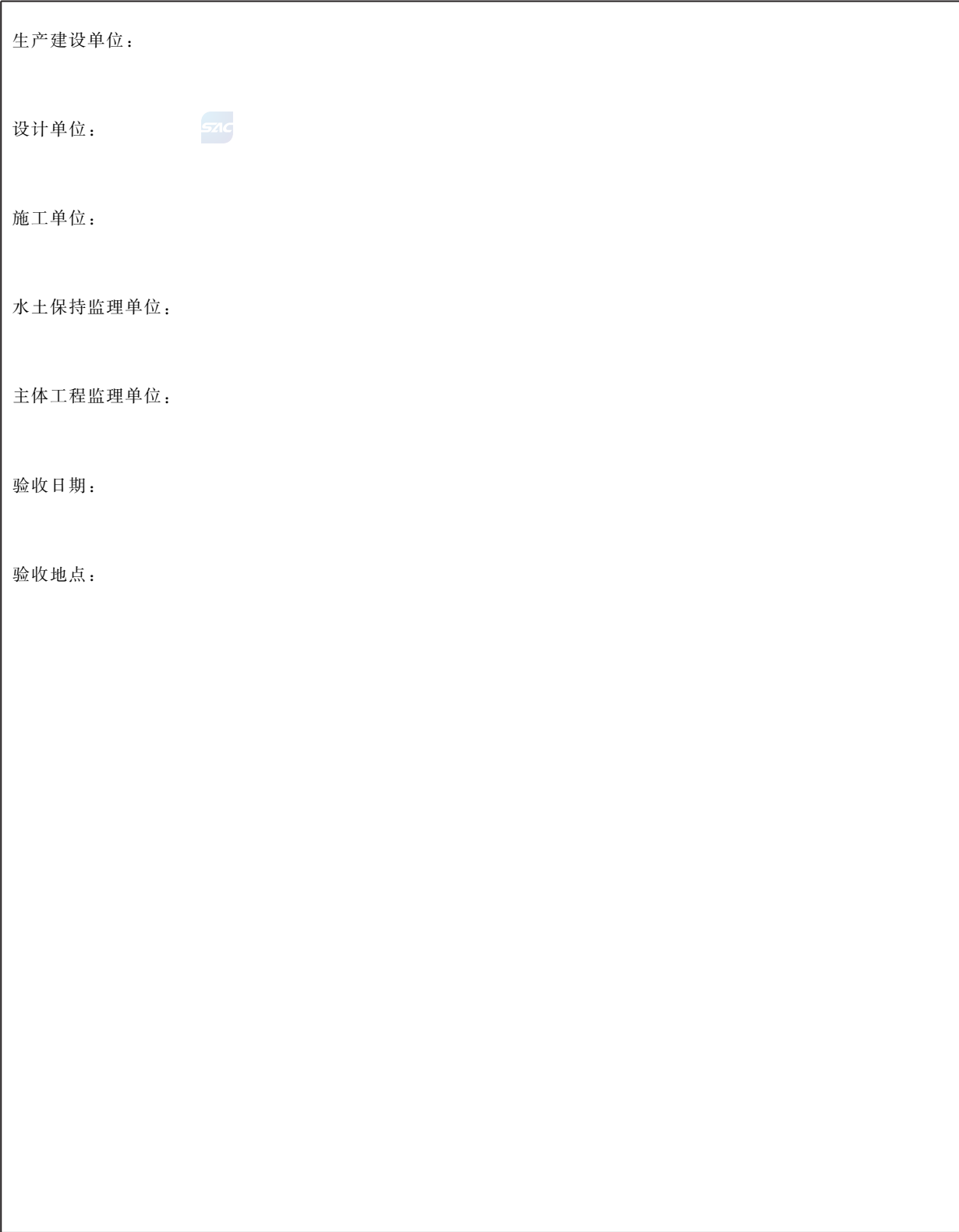
表 D.2 分部工程验收鉴定书扉页格式